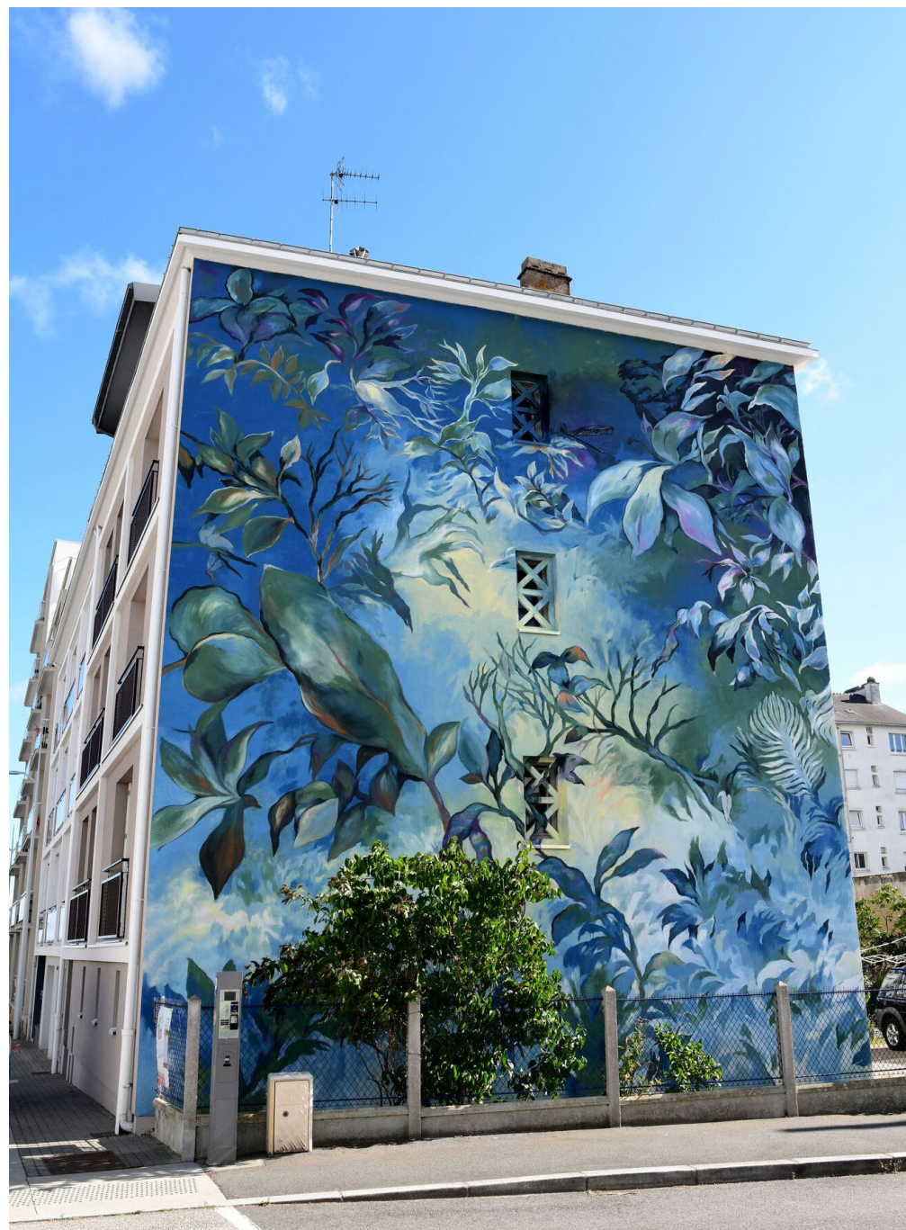
Ville de St Nazaire

En janvier 2023, le musée national Marc Chagall de Nice m'a invité à faire une exposition dans le cadre des 50 ans du musée. Le 30 mars 2024, je présente une nouvelle exposition personnelle « Le vent, la vague, l'étoile » au musée de l'Abbaye Sainte-Croix (MASC), musée d'art moderne et contemporain des Sables d'Olonne.