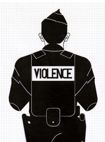
N 224 A4 700€