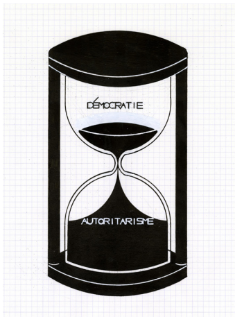
N 171 A4 700€