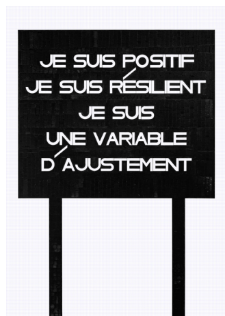
N 299 A0 3500€

L'office du dessin, Olivier Garraud Dessin à l'encre sur papier