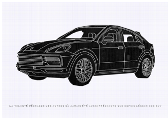
N 301 A1 2200€