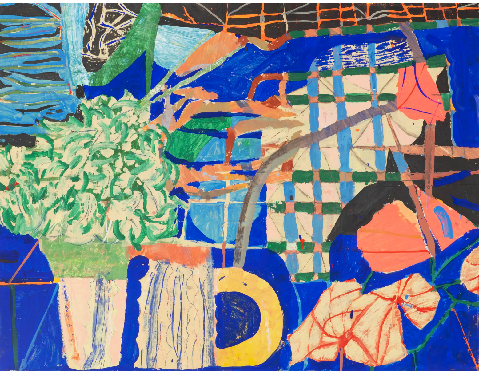
Les fleurs et la tasse