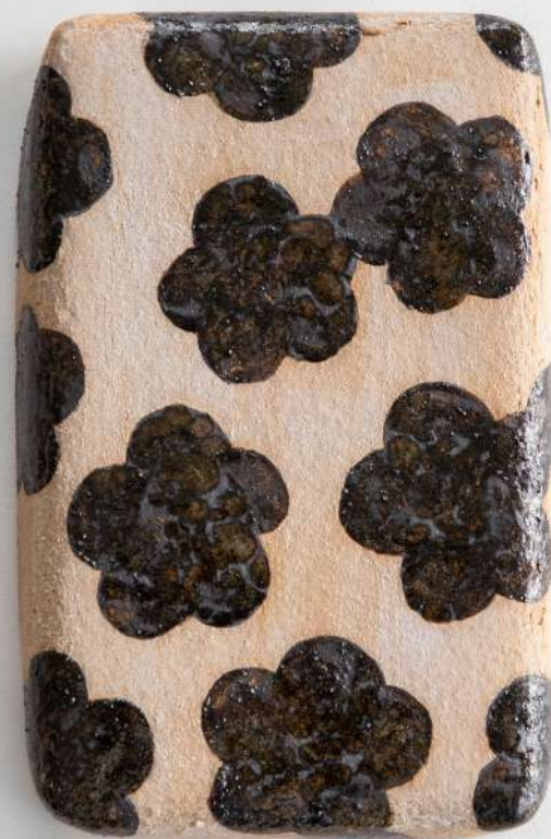
Grès, 15x24x4 cm 200€