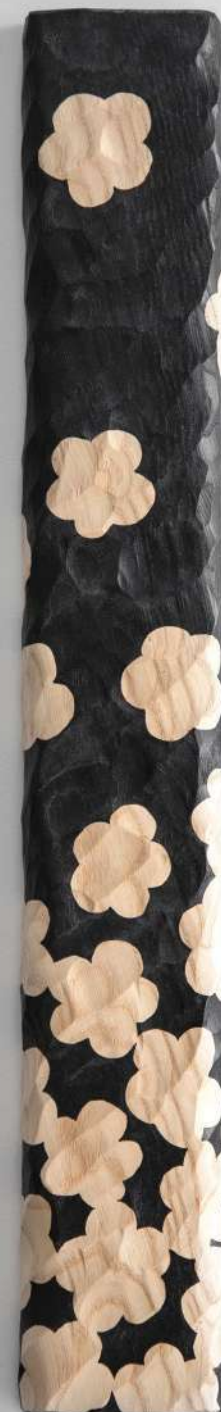
Chêne, 60,5x9x2,5 cm 400€