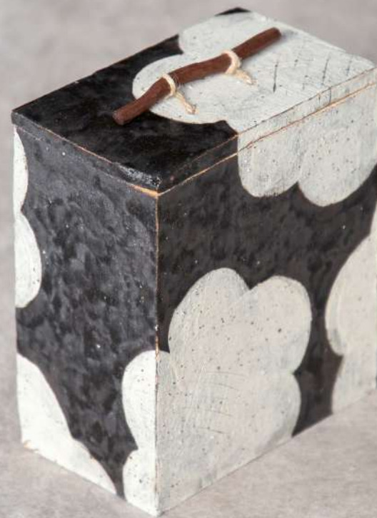
Boîte en grès, poignée en bois de noyer, 15,5x18x9,5 cm 450€