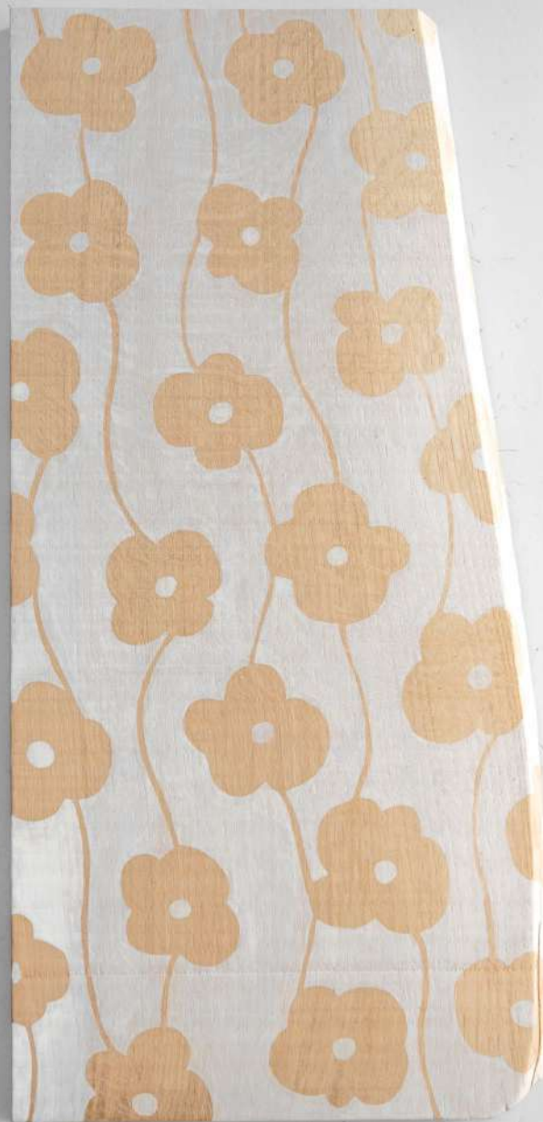
Chêne, 32x72x2,5 cm 900€