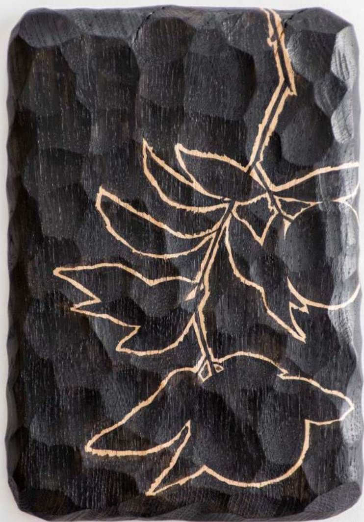
Chêne, 20x26x3 cm 300€