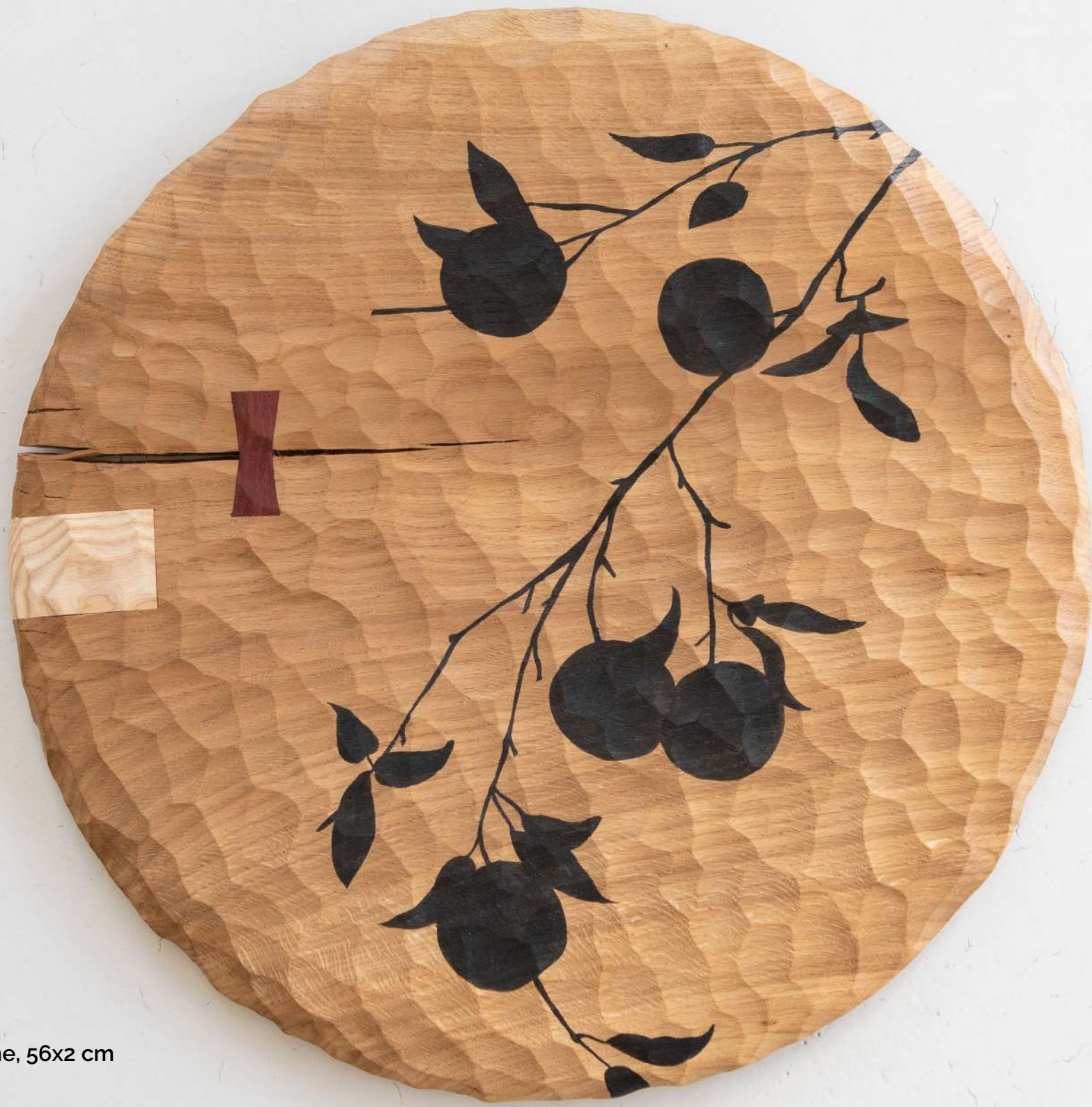
Disque en chêne, 56x2 cm 1200€