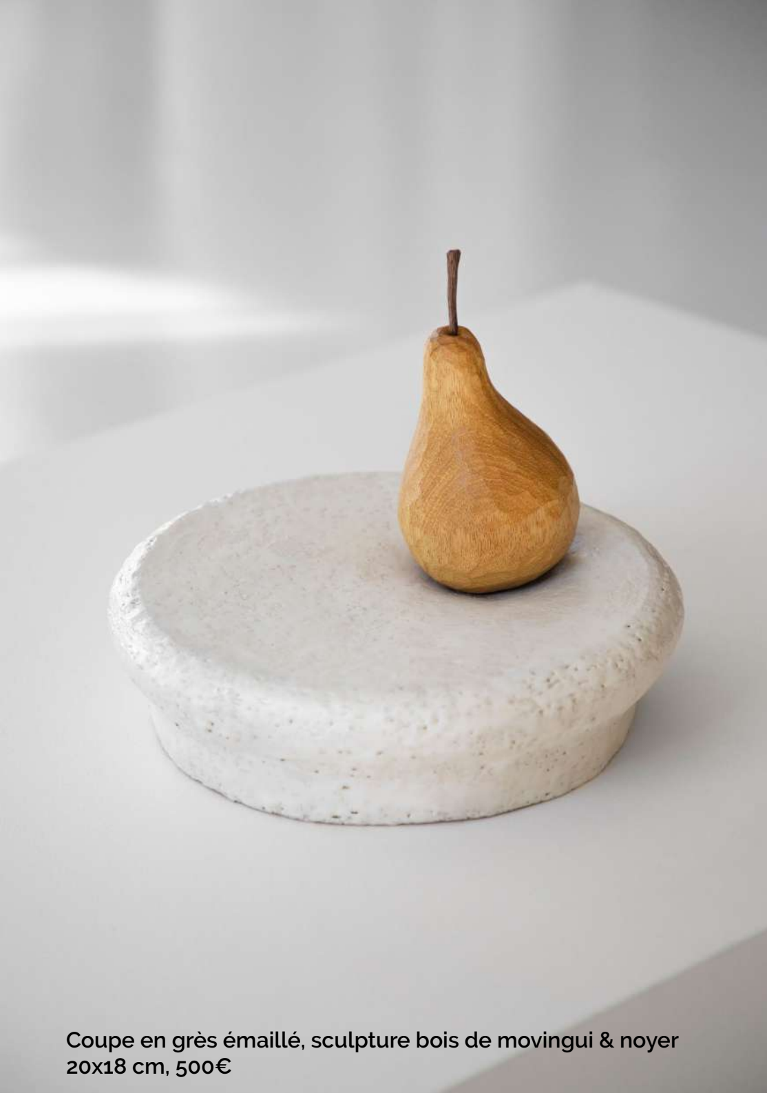
Coupe en grès émaillé, sculpture bois de movingui & noyer 20x18 cm, 500€