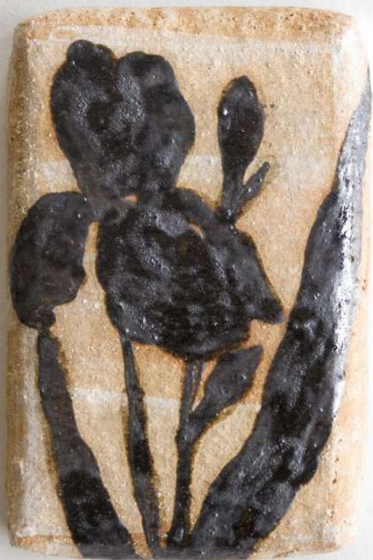
Grès, 10x14x2,5 cm 100€