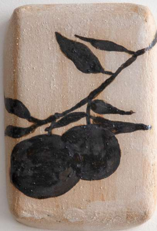
Grès, 12x18x3,5 cm 120€