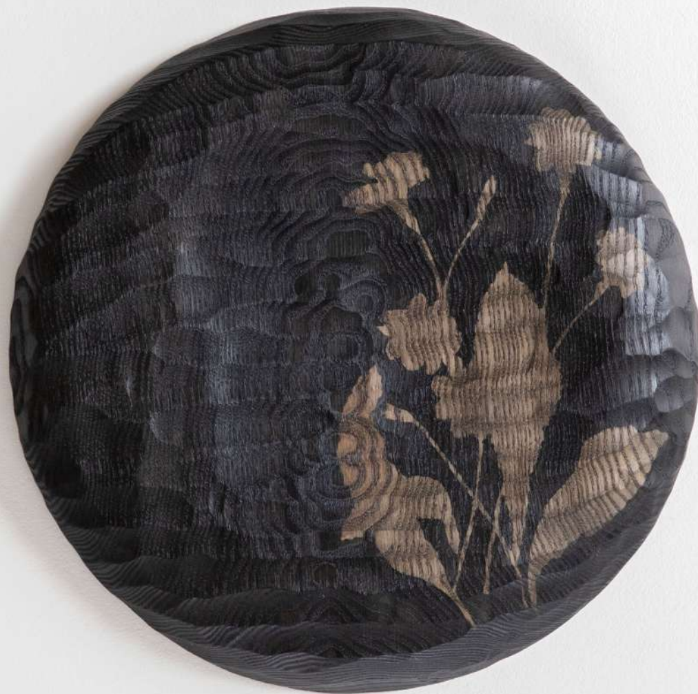
Disque en chêne, 28x3 cm 300€