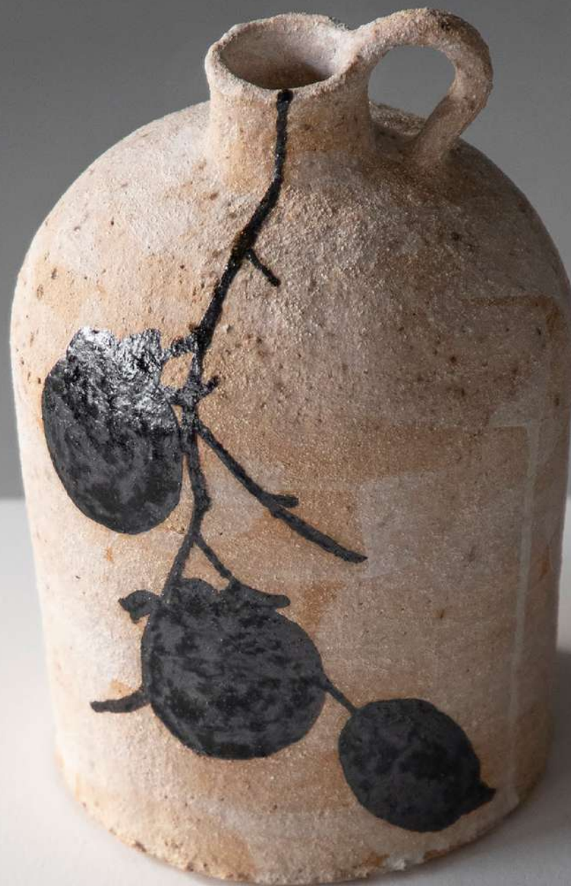
Grès, 16x22 cm 400€