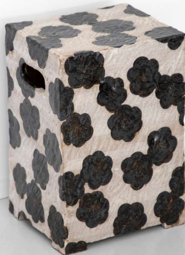
Tabouret en grès, 27x40x23 cm 2500€