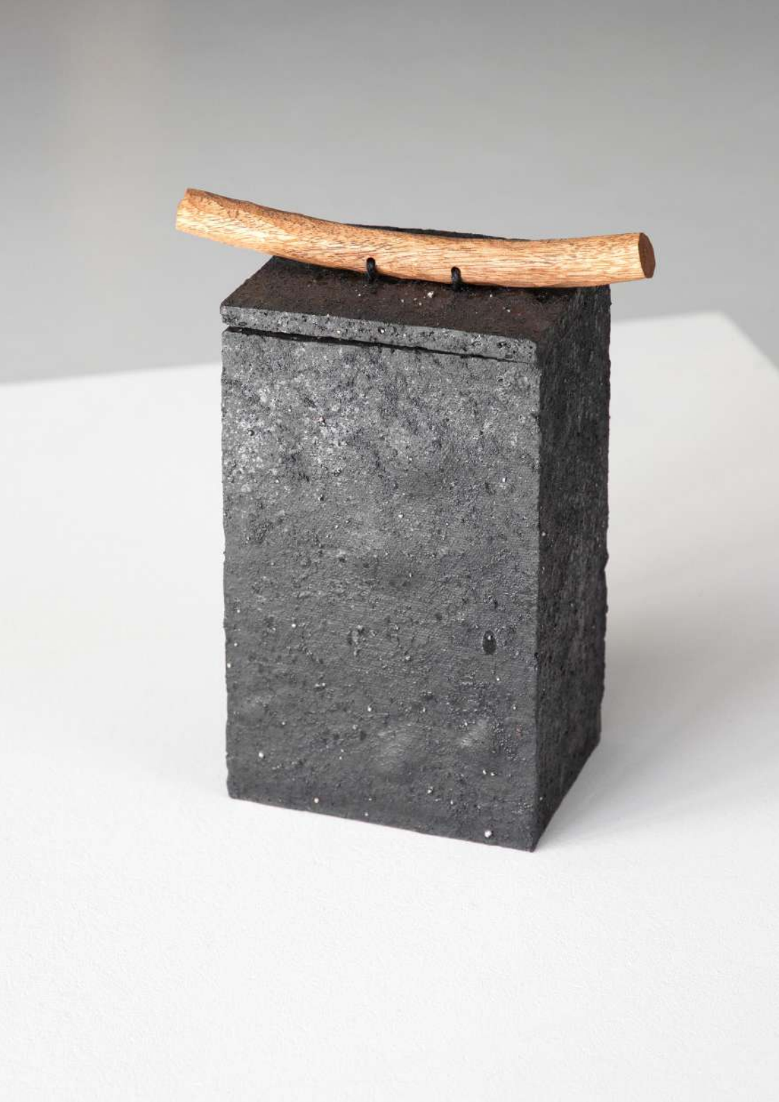
Boîte en grès, poignée bois de sipo, 12,5x22x10 cm 400€