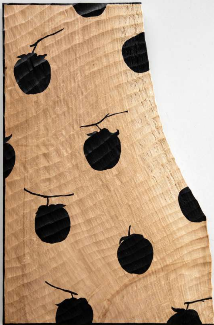
Chêne, 46x71x3 cm 1100€