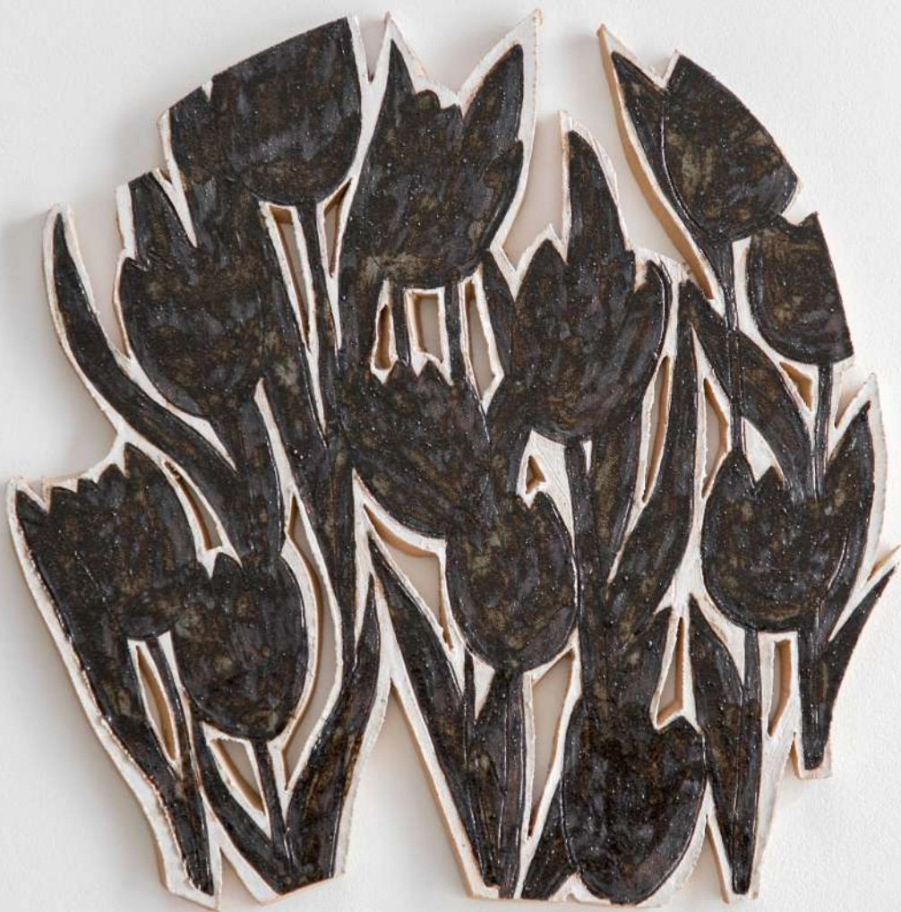
Grès, 33x36 cm 350€