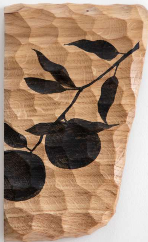
Chêne, 17x26x3 cm 180€