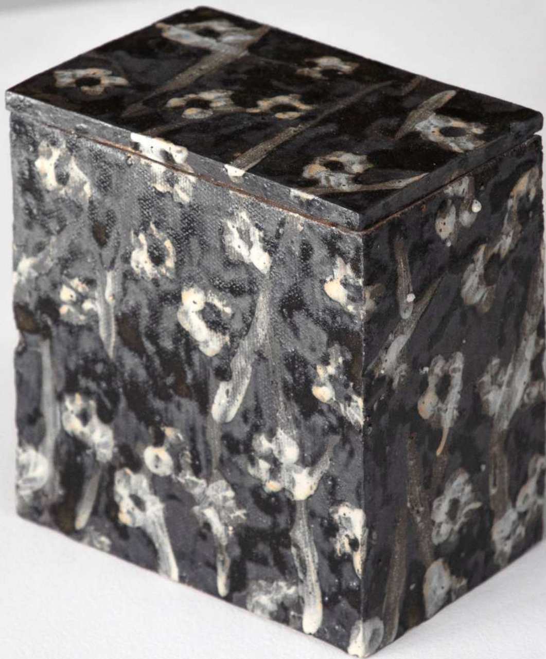
Boîte en grès, 13x13x8 cm 350€