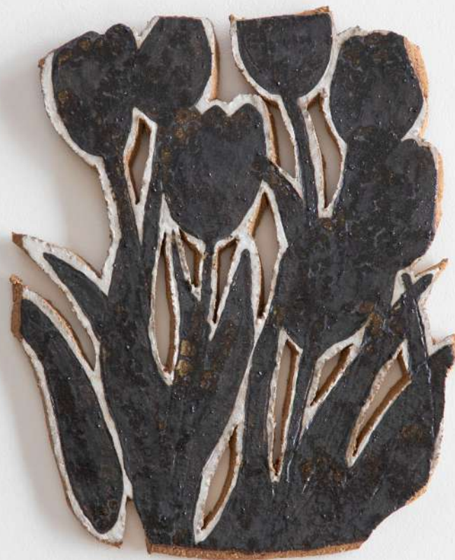
Grès, 19x22 cm 200€