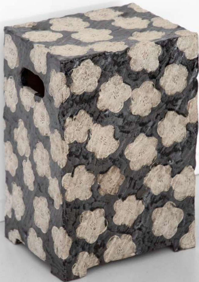
Tabouret en grès, 27x40x23 cm 2500€