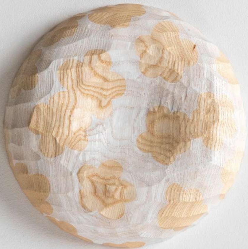
Disque en frêne, 19x4 cm 250€