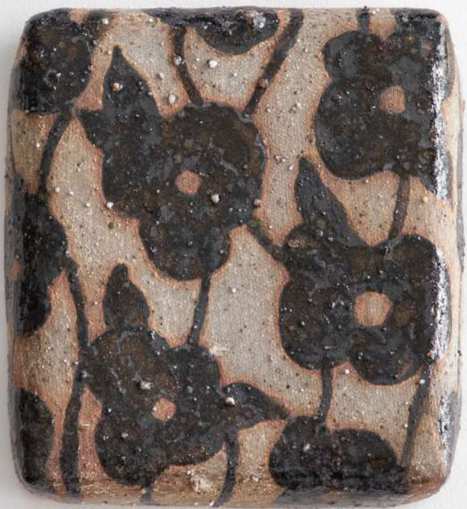
Grès, 14x13x3 cm 120€