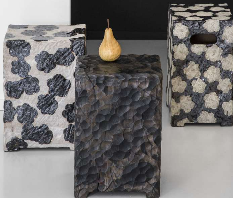
Tabouret en frêne, 27x40x23 cm 2500€