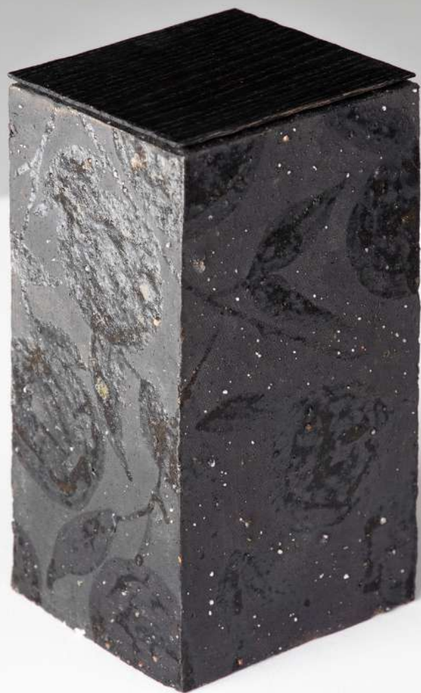
Boîte en grès, couvercle en chêne oxydé, 11x20x10,5 cm 450€