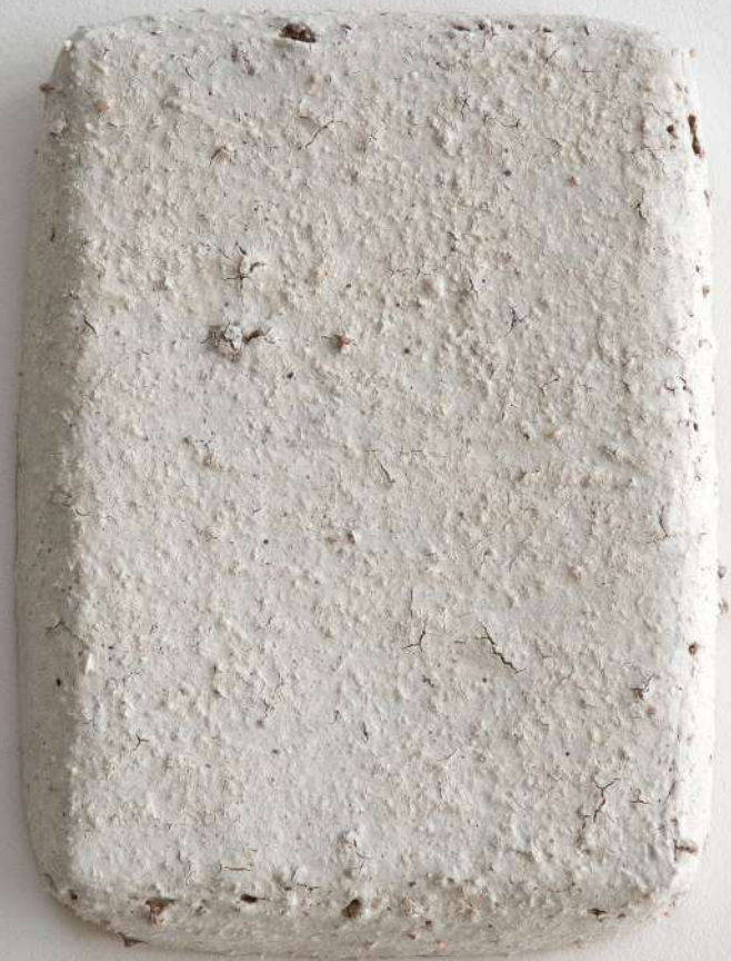
Grès engobé, cendres de chêne, éclats de granit, 13x19x4 cm 100€ (180€ les 2)