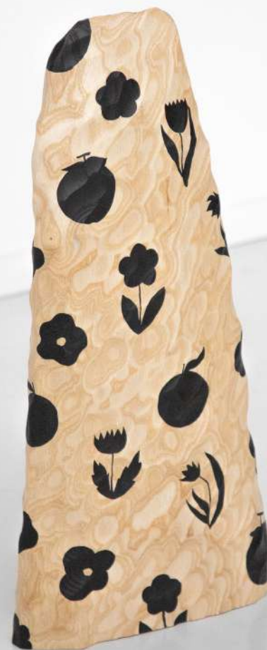
Frêne, 24x50x6 cm 1100€