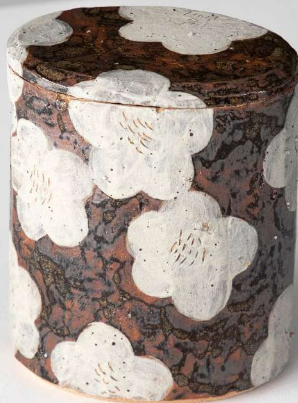
Boîte en grès, 13x15x9 cm 290€