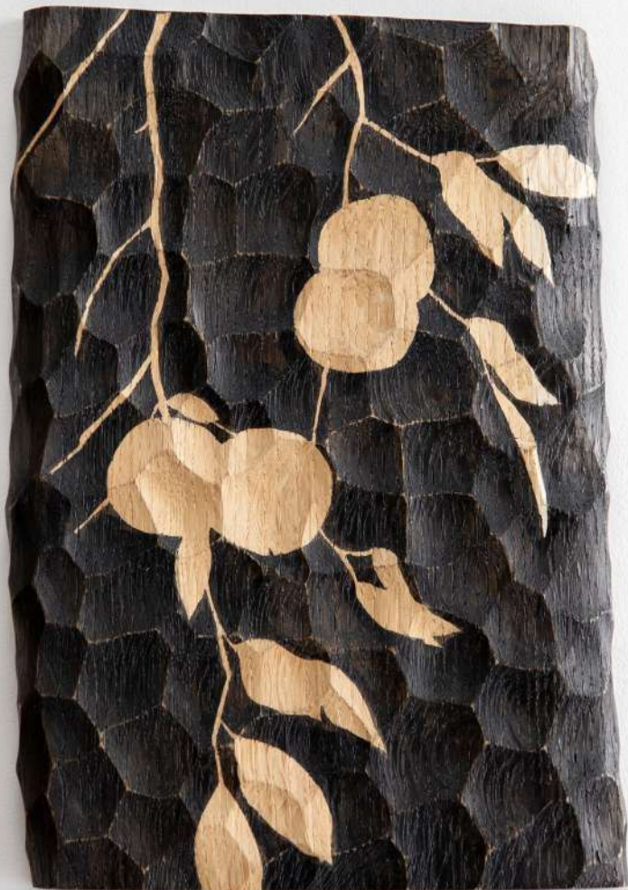
Chêne, 33,5x22x3 cm 300€