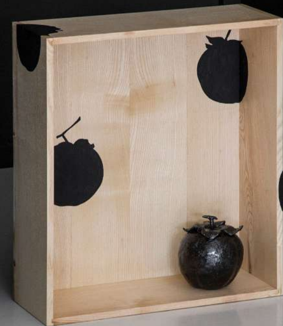
Niche en bois de frêne & grès émaillé, 33x40x13 cm 1300€