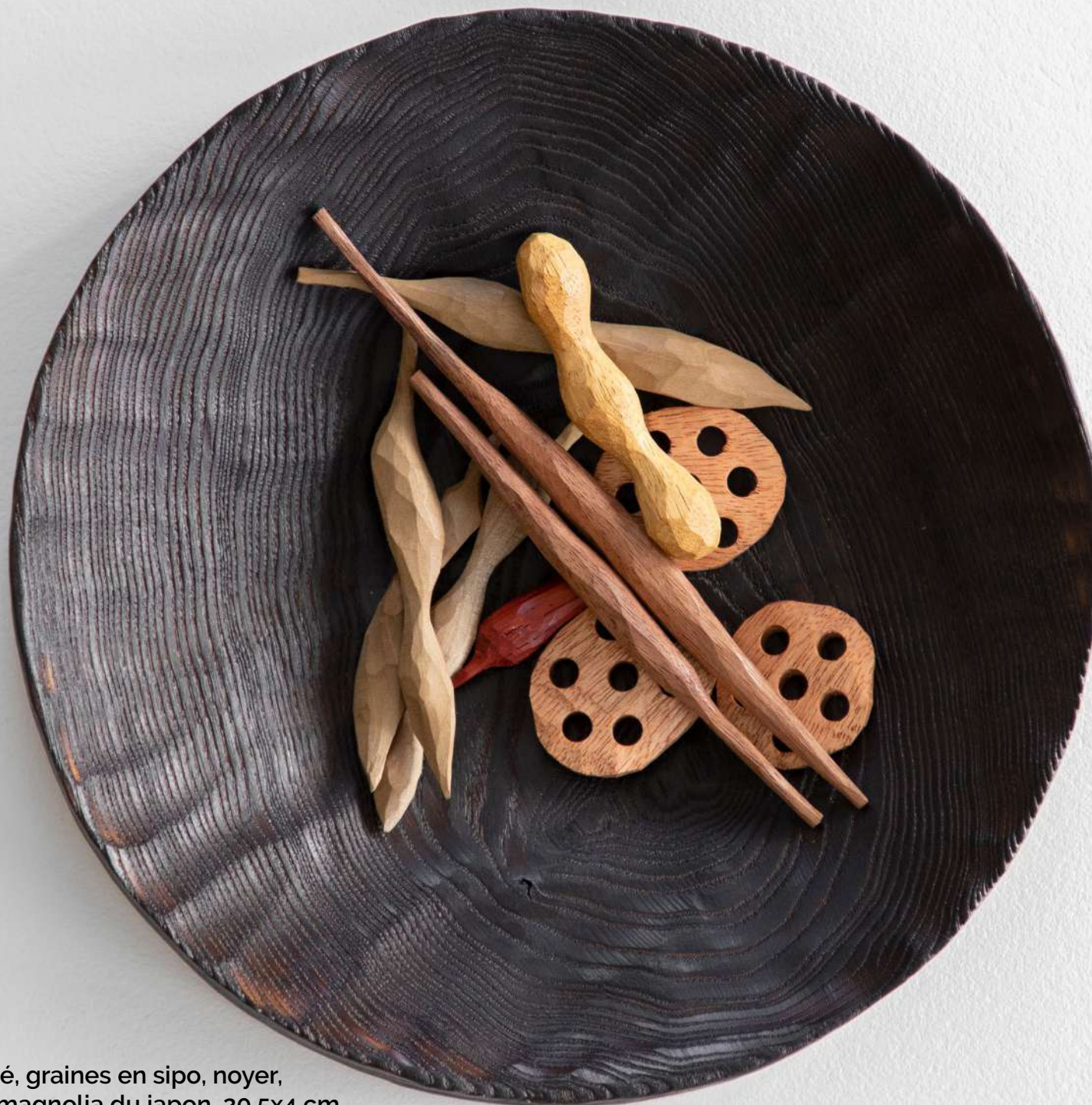
Coupe en frêne brûlé, graines en sipo, noyer, movingui, paduk et magnolia du japon, 20,5x4 cm 550€