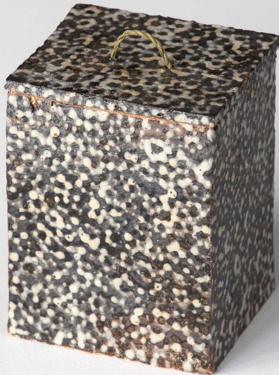
Boîte en grès, 10x13x9 cm 350€