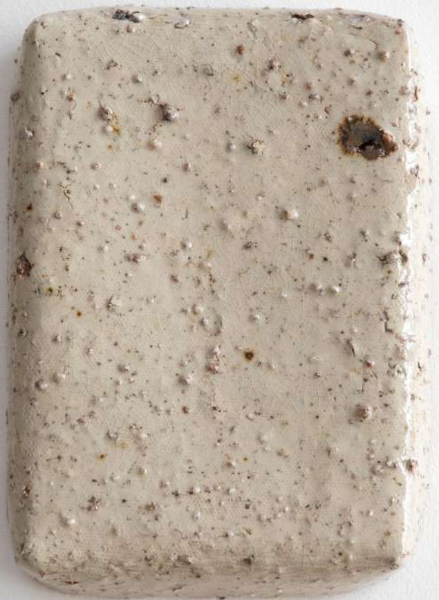
Grès émaillé, cendres de chêne, éclats de granit, 13x19x4 cm 100€