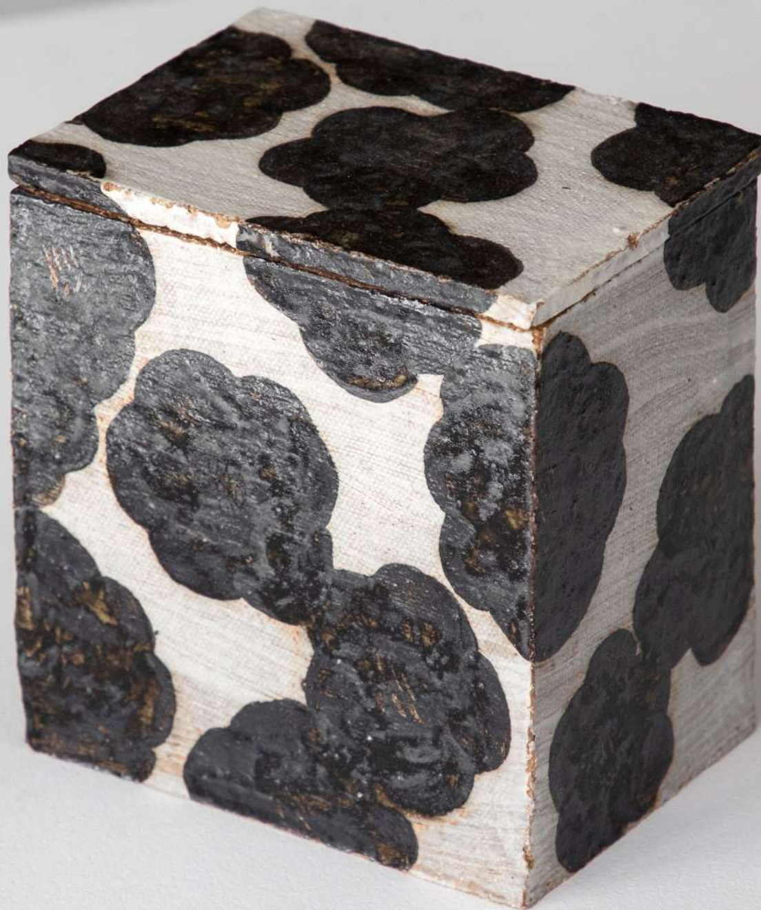
Boîte en grès, 12,5x13x9 cm 350€