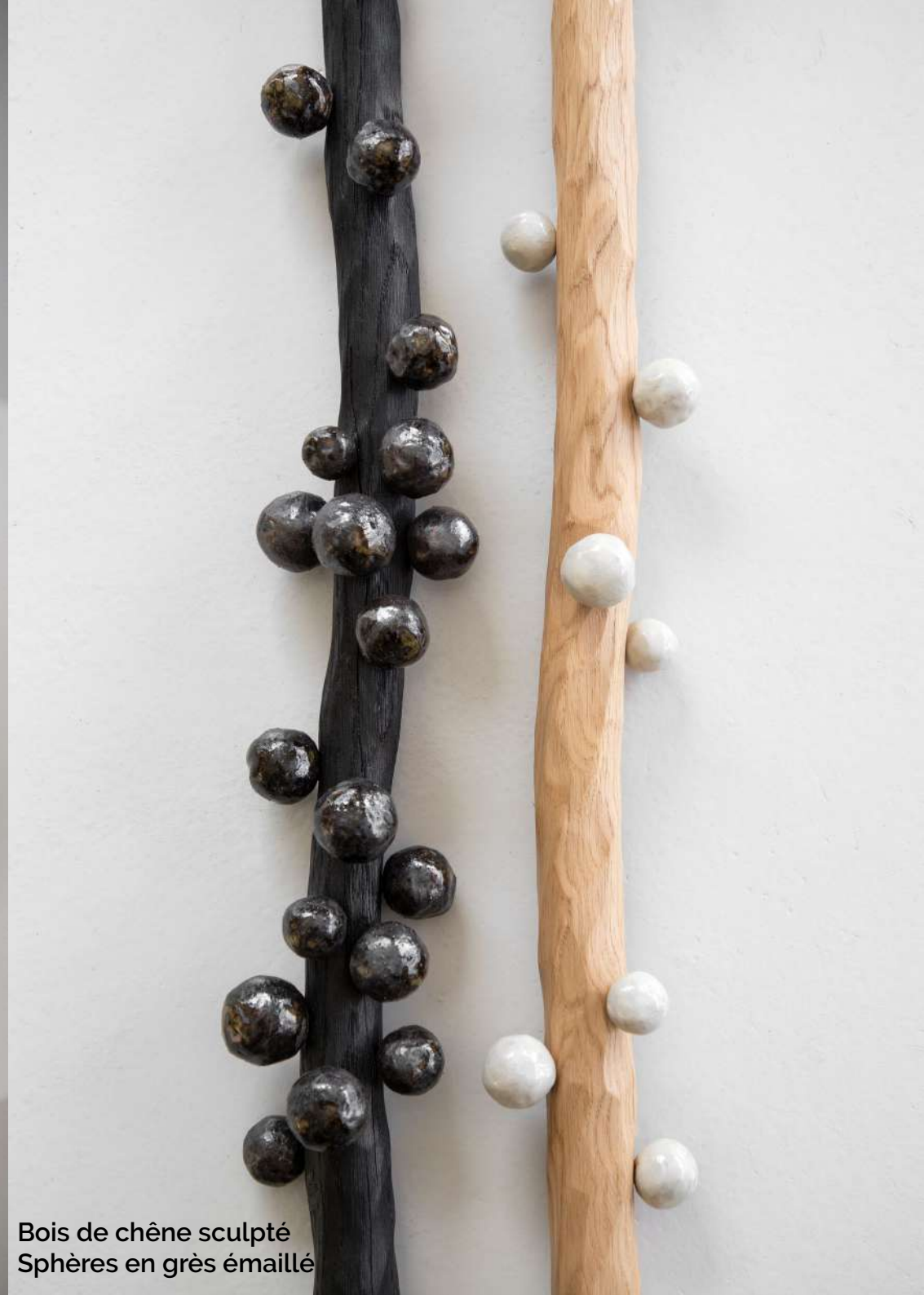
Bois de chêne sculpté Sphères en grès émaillé